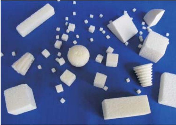
Figura 1. Diferentes formas geométricas en las que se puede presentar el xenoimplante Nukbone®, de acuerdo con la especificación del médico tratante.

los estudios de gabinete: cubos, bloques rectangulares y poligonales, lingotes y placas, como se pueden observar en la figura 1.